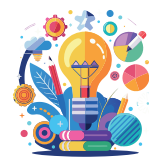
FERIA EDUCATIVA DE LA ENERGÍA

La institución educativa con la mayor cantidad de participantes en la presente edición del concurso será reconocida con la organización de una Feria educativa de la energía.